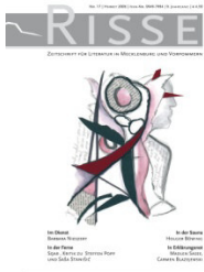
Heft 17 (Herbst 2006)

ZEITSCHRIFT FÜR LITERATUR IN MECKLENBURG UND VORPOMMERN