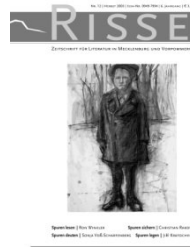
Heft 12 (Herbst 2003)