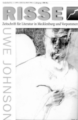
Sonderheft 1 (1999)

Ein unverzichtbarer Bestandteil jeder Ausgabe ist die graphische Gestaltung verschiedener KünstlerInnen aus MV. Hier werden nicht nur visuelle, sondern vor allem auch kulturelle Akzente gesetzt, welche die Bedeutung der RISSE für die kulturelle Entwicklung im Land Mecklenburg-Vorpommern noch einmal besonders hervorheben.