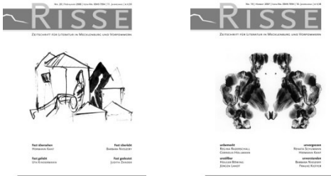
Heft 20 (Frühjahr 2008)